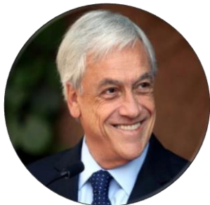
Sebastián Piñera Presidente de la República