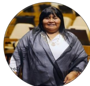
Emilia Nuyado Diputada por el distrito 25 de la Región de Los Lagos