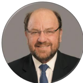
Alfredo Moreno Ministro de Desarrollo Social