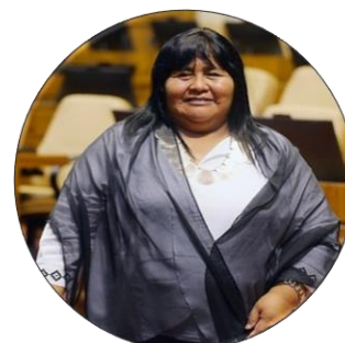
Emilia Nuyado Diputada por el distrito 25 de la Región de Los Lagos