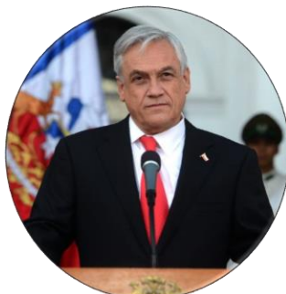
Sebastián Piñera Presidente de la República