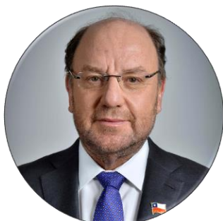
Alfredo Moreno Ministro de Desarrollo Social