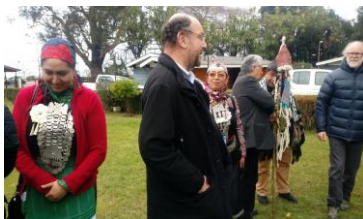
Presidente Piñera recibe las conclusiones del Plan Araucanía

Otra noticia relevante en relación al Plan, fue la postergación de su anuncio para el mes de septiembre, puesto que aún se buscaban los recursos para su ejecución . Sin embargo, a finales de mes Moreno y Mayol, junto a un comité interministerial entregaron un documento final con las medidas propuestas para el Plan . Según mencionó el intendente de la Araucanía Luis Mayol, el plan tendría tres ejes: agrícola, turístico y de energías renovables .