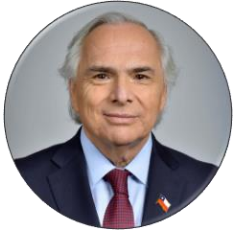
Andrés Chadwick Ministro del Interior y Seguridad Pública