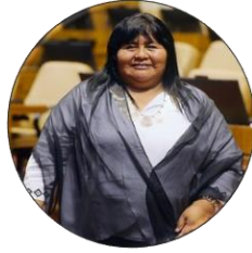
Emilia Nuyado Diputada por el distrito 25 de la Región de Los Lagos