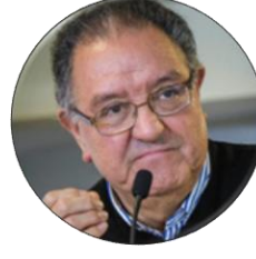
Francisco Huenchumilla Senador por la Región de la Araucanía