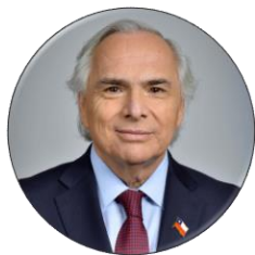
Andrés Chadwick Ministro del Interior y Seguridad Pública