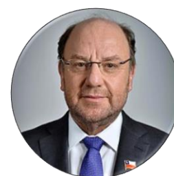
Alfredo Moreno Ministro de Desarrollo Social