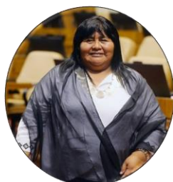
Emilia Nuyado Diputada por el distrito 25 de la Región de Los Lagos