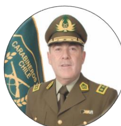
Hermes Soto Ex General Directo de Carabineros