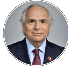
Andrés Chandwick Ministro del Interior