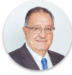
Francisco Huenchumilla Senador Región de la Araucanía.