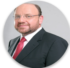
Alfredo Moreno Ex Ministro de Desarrollo Social