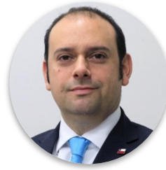
Ignacio Malig Director Nacional de CONADI