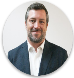
Sebastián Sichel Ministro de Desarrollo Social