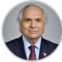
Andrés Chadwick Ministro del Interior