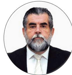
Rodrigo Ubilla Subsecretario del Interior